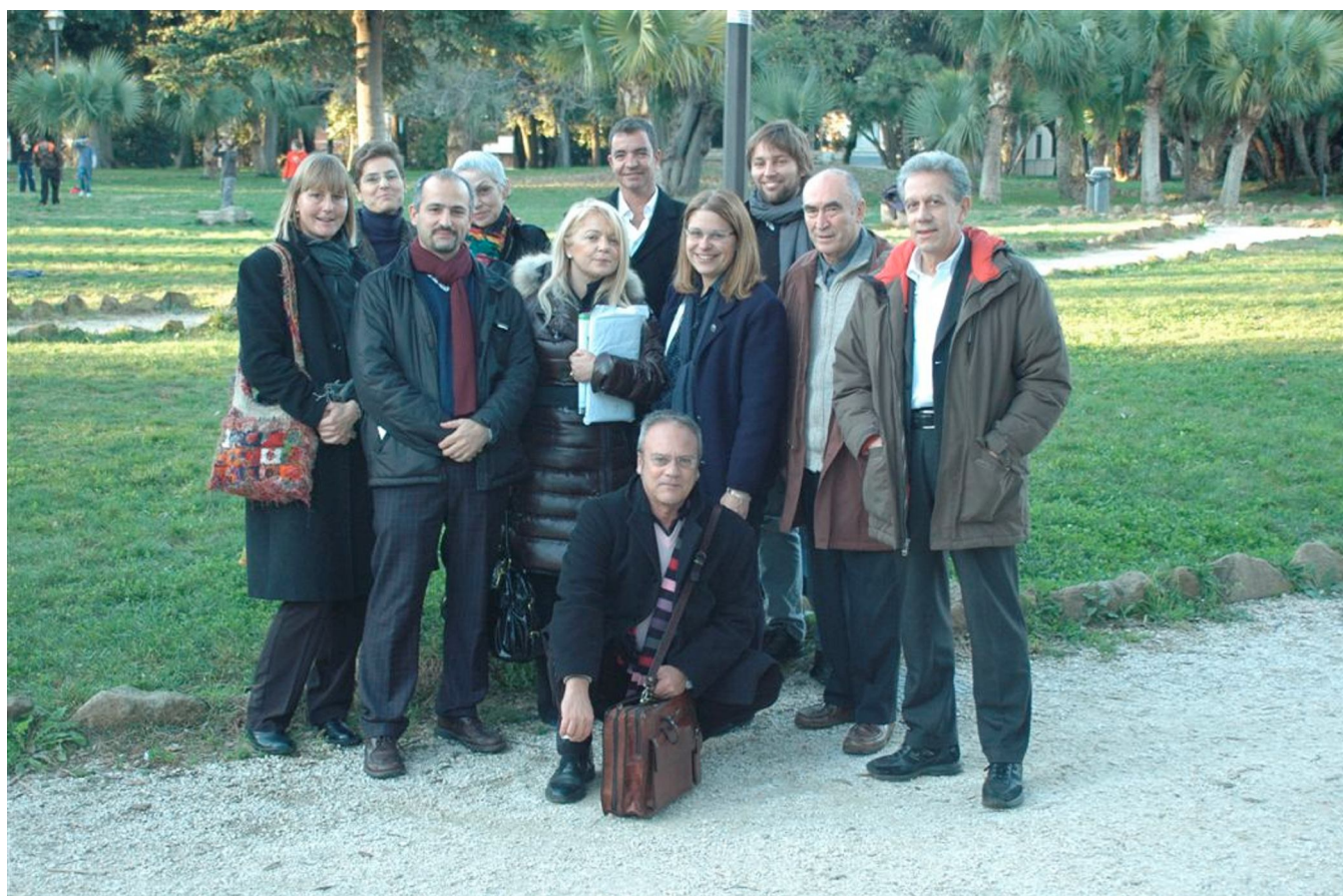
Foto di gruppo della giuria e segreteria del premio alla fine dei lavori scattata a Villa Torlonia il 5 Dicembre scorso.